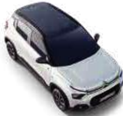
POLAR WHITE BODY WITH PLATINUM GREY ROOF