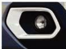
VIBE PACK: POLAR WHITE