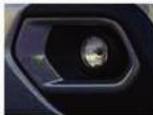
VIBE PACK: STEEL GREY