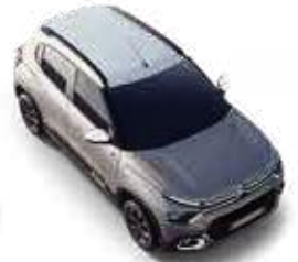
STEEL GREY BODY WITH POLAR WHITE ROOF