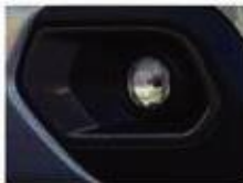
VIBE PACK: PLATINUM GREY