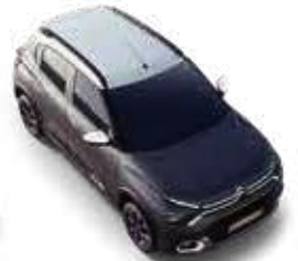
PLATINUM GREY BODY WITH POLAR WHITE ROOF