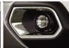
ELEGANCE PACK: CHROME*

*Optional with Charging Station Included