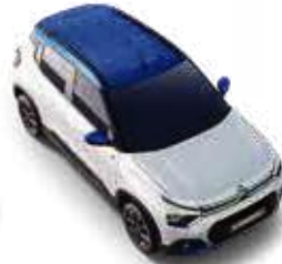
POLAR WHITE BODY WITH COSMO BLUE ROOF