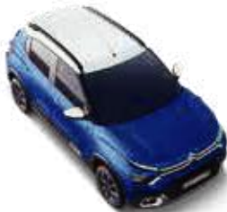
COSMO BLUE BODY WITH POLAR WHITE ROOF