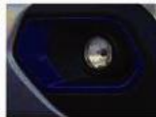
VIBE PACK: COSMO BLUE