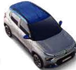
STEEL GREY BODY WITH COSMO BLUE ROOF